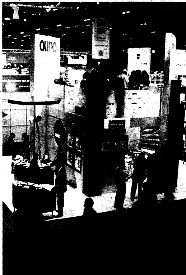
Más de 150 expositores mostrarán sus novedades al público asistente

«El auge de los "ERP" y "CRM" de finales de los noventa han dado paso a las soluciones a medida de las compañías del mercado del software —expli-